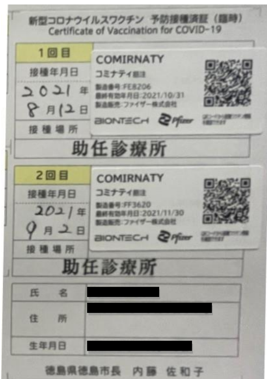
ワクチン接種証明 (例)